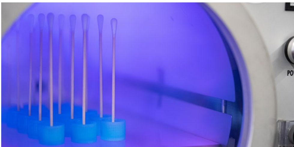
Abb. 1: Abstrichtupfer in der Laborplasmaanlage

Plasmaanwendungen findet man mittlerweile in allen Branchen wieder, ob es sich um Medizinprodukte, Bauteile im Automotivbereich oder Konsumgüter handelt. Auch bei dieser Anwendung können mit Hilfe einer Plasmabehandlung, die Oberflächeneigenschaften der Wattestäbchen positiv beeinflusst werden. Plasma wird auch der „vierte Aggregatzustand“ genannt und wird erreicht, indem man einem Gas weiter Energie zuführt. Dabei entstehen reaktive Spezies (negativ geladene Elektronen und positiv geladene Ionen), welche mit der Oberfläche der Bauteile interagieren und die Eigenschaften dieser verändern.