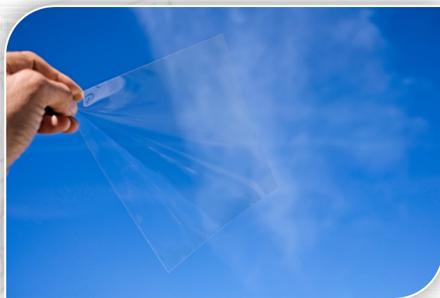
TranDuctive® layer coated on PET